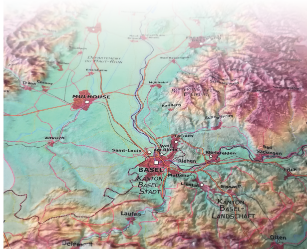
Carte en relief du Rhin supérieur / Reliefkarte des Oberrheins

GeoRhena wird durch elf öffentliche Partner finanziert, die ebenfalls Mitglied in der Oberrheinkonferenz sind. Das Werkzeug ist seit über 15 Jahren im Einsatz und hat somit eine Vorreiterrolle in Europa. Ohne den Willen der Partner und die Dynamik des grenzüberschreitenden Expertenausschusses wäre dies nicht möglich gewesen.